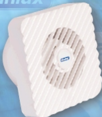
Zefir elszívóventilátor 100mm Ø 100m 3 /h kisebb beépítési mélység