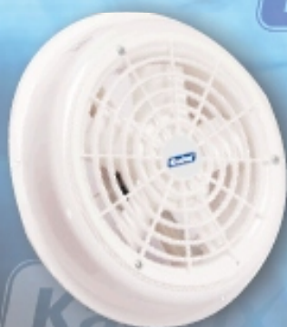
WK 01 Ablakventilátor 150mm Ø 200m 3 /h